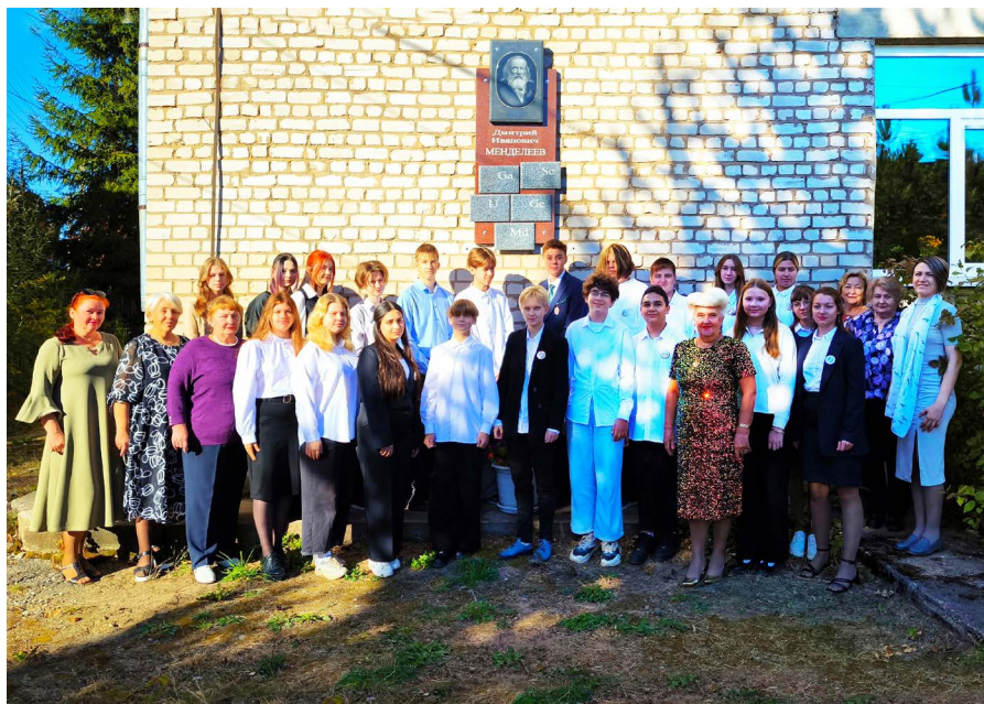
Коллектив и учащиеся А-школы у памятного знака на здании А-школы

Впервые Менделеевский праздник был проведён 28 мая 1988 года. В ходе торжества на доме во Млёве