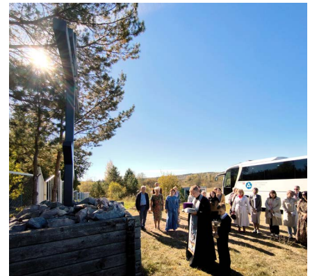
Освящение Поклонного креста у Тихомандрицкого погоста