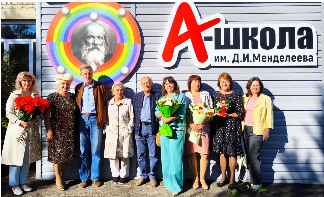
Учёные из г. Твери и администрация г. Удомля

была открыта мемориальная доска, а рядом заложена памятная «Аллея признания» из молодых дубков.