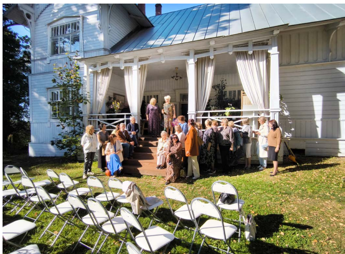
Гости Менделеевского праздника на даче «Чайка»