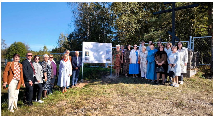
Гости Менделеевского праздника у информационного щита

Завершился праздник душевным музыкально-поэтическим вечером в уютном кафе «Русский стиль». Здесь