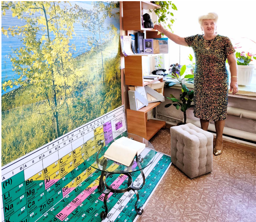
Экспонаты музея Менделеева в А-школе