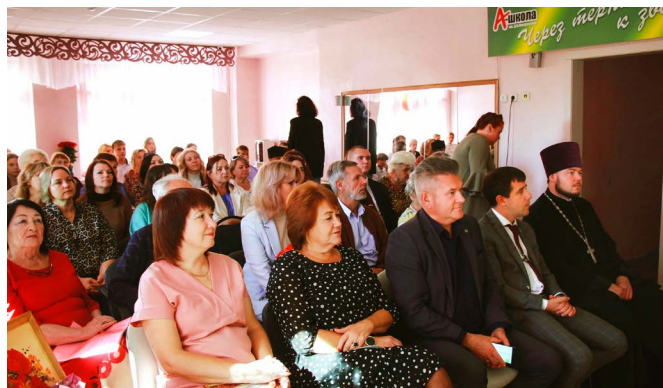
Конференция в зале А-школы

ственного признания «Почётный гражданин России»