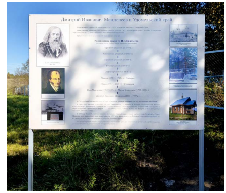
Информационный щит у Тихомандрицкого погоста