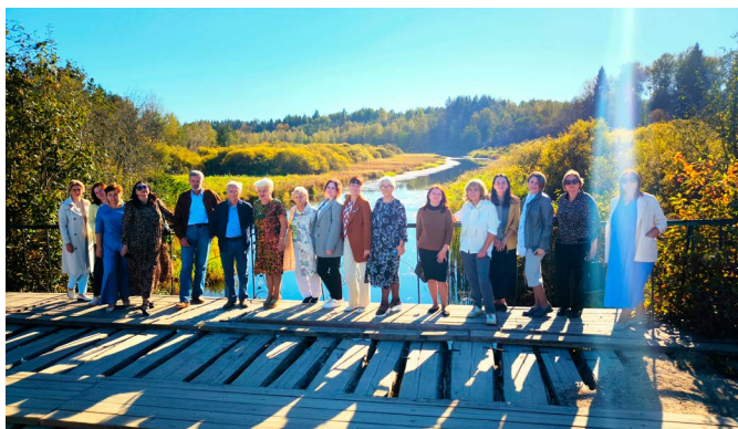
На месте-мосточке, где И.Левитан написал картину «Золотая осень»