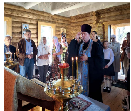
Служба в новой часовне Покрова Пресвятой Богородицы (деревня Касково), освященной в 2023 году