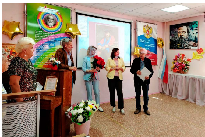
Поздравление от учёных из Твери (Тверской государственной университет)